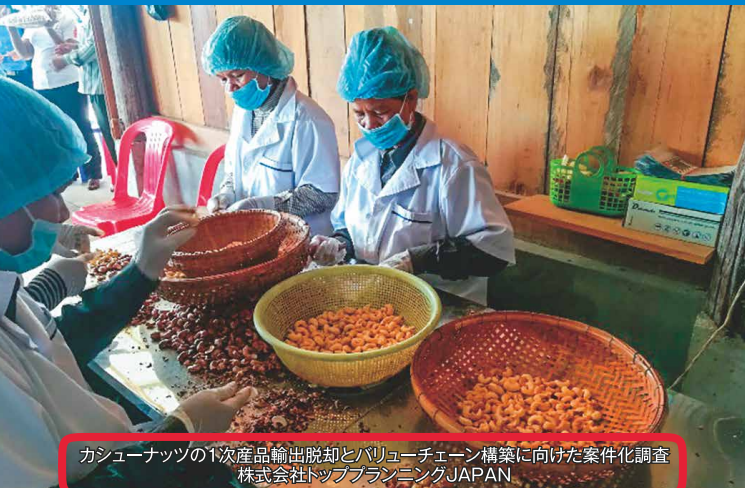
カシューナッツの1次産品輸出脱却とバリューチェーン構築に向けた案件化調査 株式会社トッププランニングJAPAN